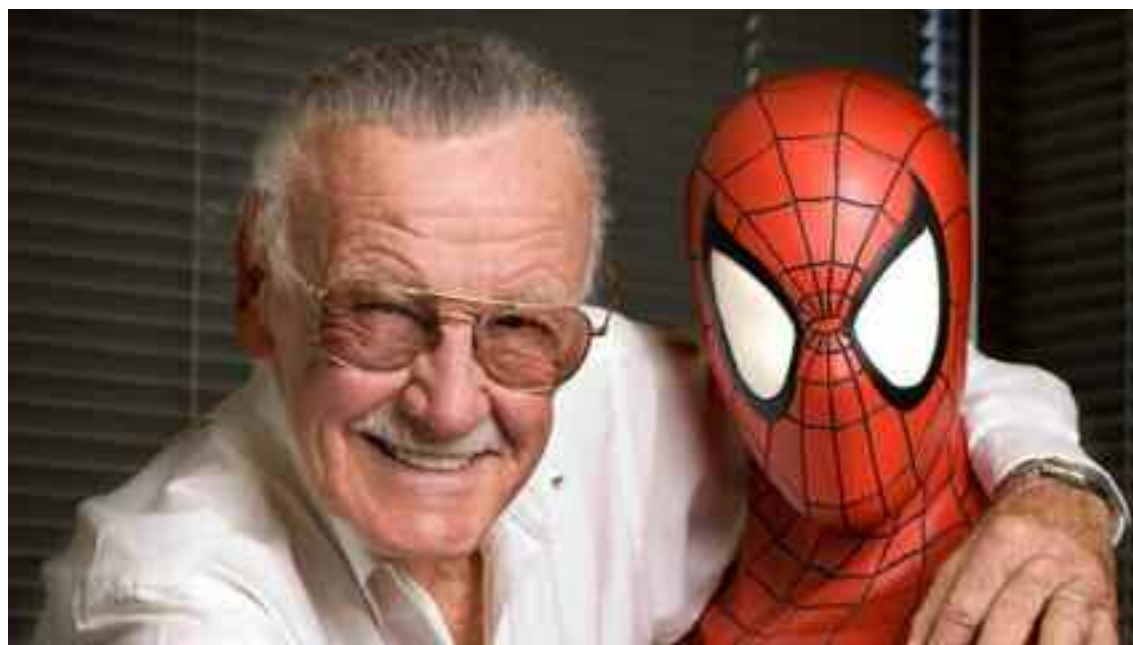
Además del Hombre Araña, Stan Lee creó muchos otros personajes emblemáticos del mundo del cómic y el cine como Hulk, Los Cuatro Fantásticos, Iron Man, Los Vengadores, X Men y, más recientemente, Pantera Negra