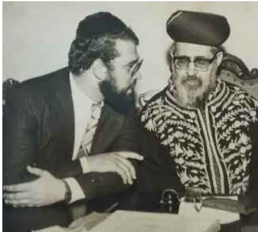
El rabino Isaac Cohen con el entonces Gran Rabino Sefardí Ovadía Yosef Z'L, en 1978. Esta imagen forma parte de la exposición "40 fotos para 40 años" que se presentó en la sinagoga TIDE durante la celebración de las cuatro décadas del rabino Cohen en Venezuela

cuando uno anula el ego. Cuando el ego no trata de llenar y controlar todo el espacio alrededor de uno, sino que hace espacio para el otro. El vacío es el preludio necesario para un modo de existencia completamente nuevo y superior.