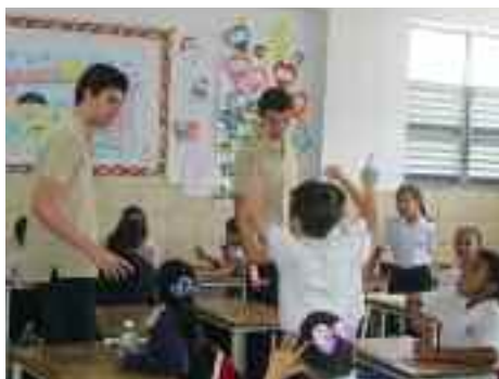
Estudiantes del IB del "Moral y Luces" fungen como profesores durante un día

Las actividades que realiza CAS a través