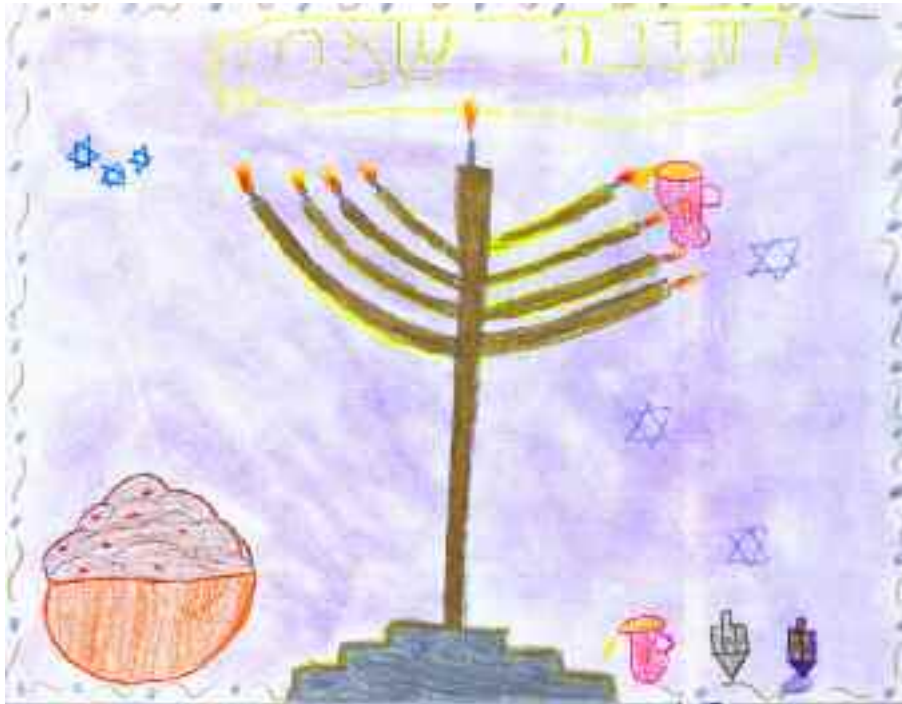
Deborah Chocrón primer grado del Colegio Cristóbal Colón Sinai