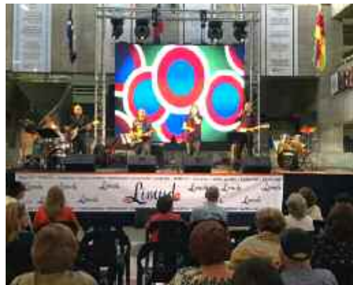
La Banda Poker durante una de sus presentaciones