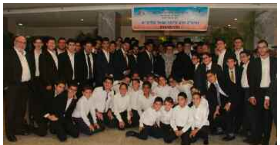
Los alumnos y personal docente del Colegio Maor HaTorá dieron una bienvenida entusiasta a los rabinos