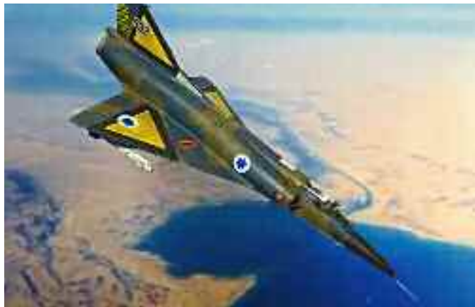
El caza israelí Nesher superó a la versión original francesa, el Mirage 5

En 1967, Francia boicoteó a Israel. Cuando estalló la Guerra de los Seis Días, el presidente francés Charles de Gaulle impuso un embargo de armas contra Israel. La entrega de 50 unidades del Mirage 5 construidas especialmente para la Fuerza Aérea de Israel se detuvo incluso antes de que comenzara. Pero este boicot