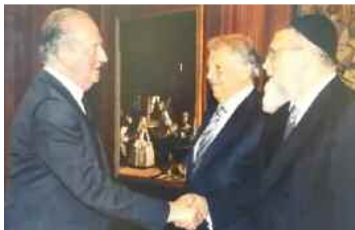
El rabino Cohen con el rey emérito de España, Juan Carlos I, acompañado de Saadia Cohen, en el palacio Real de Madrid en 2013 (imagen de la exposición "40 fotos para 40 años")

Conocí al rabino Cohen en 1977, a mi regreso de Filadelfia al término de mis estudios de doctorado. Para ese momento yo no detentaba ningún cargo en la Asociación Israelita de Venezuela; lo conocí como cualquier otro miembro de la institución.