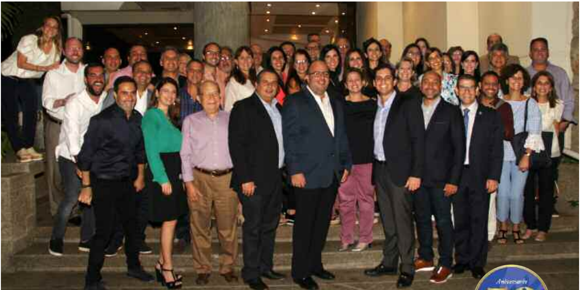
La nueva Junta Directiva de Hebraica