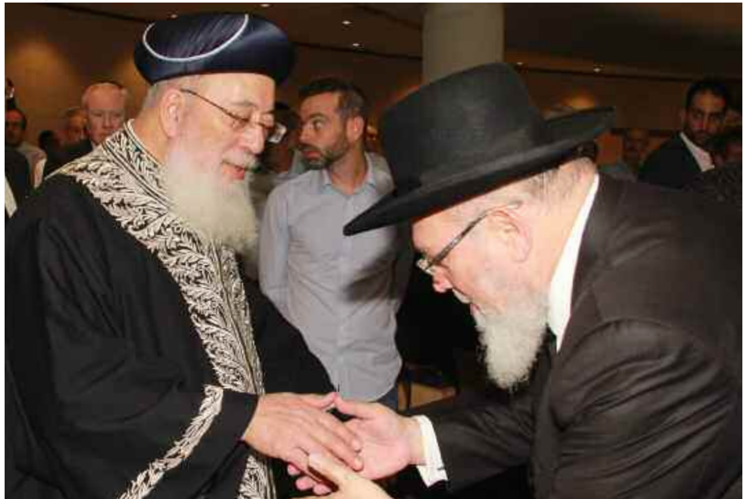
El rabino Cohen recibe al Gran Rabino Shlomo Amar

(...) Al ser una figura reconocida, exitosa y querida, respetada, con antigüedad reconocida y futuro predecible, su rol de líder ha de ser más exigido. Las comunidades judías son demandantes. Muchas ba-