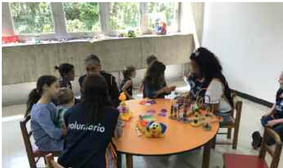
Para los más pequeños: Limud Kids