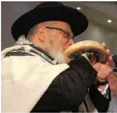
El Gran Rabino obsequió al rabino Cohen un talit y un shofar , los cuales el homenajeado "estrenó" con gran orgullo

El elemento más destacado de los homenajes al rabino Isaac Cohen fue la visita a nuestro país del rabino Shlomo Moshe Amar, shlitá , quien fuera Gran Rabino sefardí de Israel entre 2003 y 2013 y actualmente funge como Gran Rabino de Jerusalén, y mantiene el título de Rishon Letzión (rabino primado).