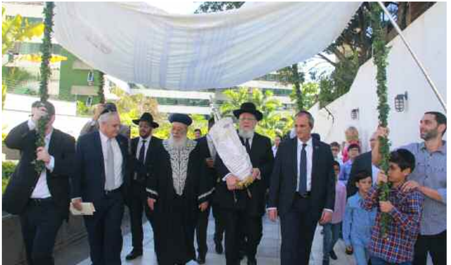
Llegada del nuevo Séfer Torá a la sinagoga Tiféret Israel del Este, con una comitiva de rabinos y miembros de la kehilá

(...) En pocas horas comienza la celebración de Janucá. La historia nos relata que cuando los Jashmonaim vieron que los griegos querían quitarles sus valores espirituales, y sintieron que el cumplimiento de la Torá se encontraba en riesgo, vencieron sus miedos, salieron a luchar contra ellos, en contra de la corriente. En esa época y en ese lugar había valores que parecían ser buenos y no lo eran, lo que estaba de moda era lo contrario a lo espiritual, a lo bueno, a lo excelso. Así como ellos lucharon por la continuidad de los valores espirituales, así nuestro rabino, Cohen como eran los Jashmonaim , sale a luchar por nuestros principios, nos enseña con fervor la importancia de seguir el camino de la Tora aún cuando el mundo exterior nos haga creer que estamos equivocados, o que somos anticuados”.