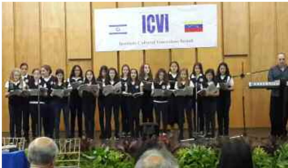
Las futuras benot mitzvá deleitaron al público con sus interpretaciones