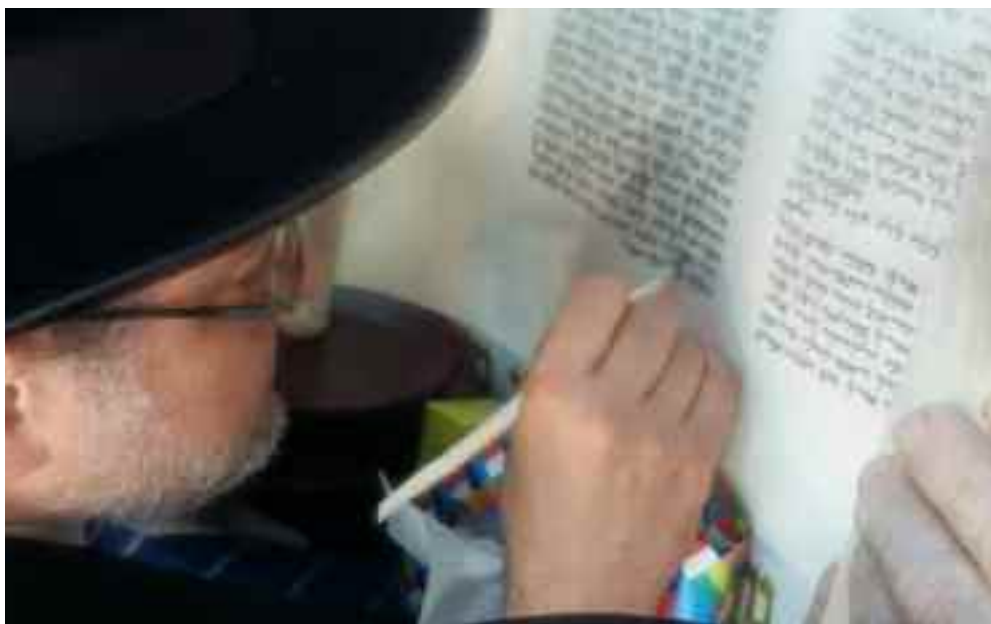
El escurpulosos proceso de trazar las últimas letras de la Torá, para hacerla utilizable