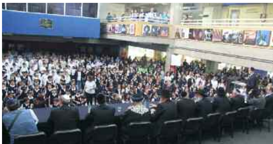
En la plaza central del Liceo Moral y Luces "Herzl-Bialik" se concentraron los estudiantes de todos los colegios comunitarios