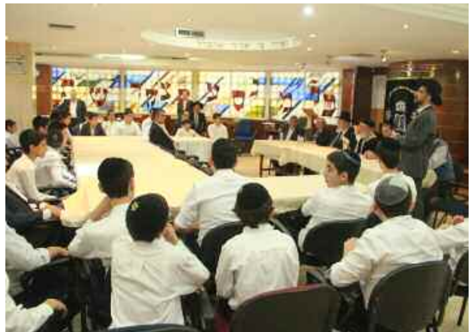
Un breve shiur para los alumnos del Colegio Sinai