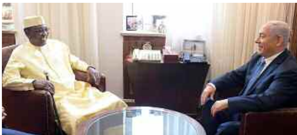
El presidente de Chad, Idriss Déby, durante su visita al primer ministro Netanyahu en Jerusalén

profundamente divididos. Hamás, a imagen de semejanza de Hezbolá en el Líbano, busca conseguir la disuasión militar frente a Israel. Se trata de una apuesta que podría llevar al grupo terrorista islámico al borde del abismo.