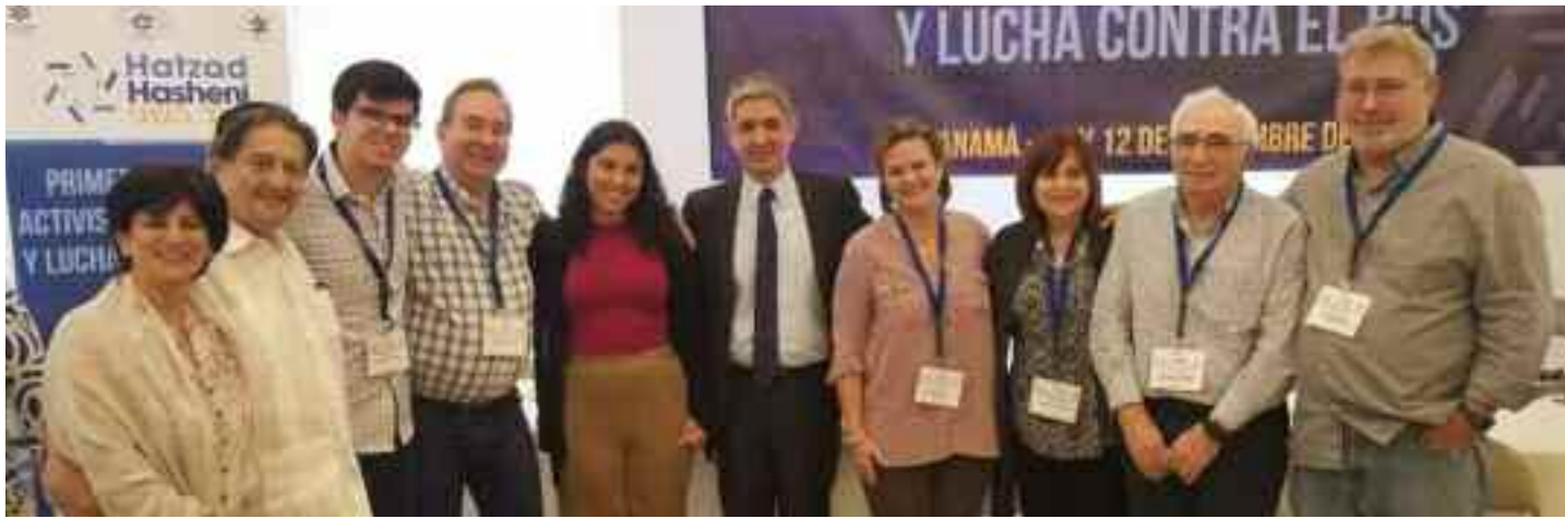
El grupo de delegados venezolanos junto al embajador de Israel en Panamá, Reda Mansour

nes. Todo ello marca un absoluto contraste con las campañas de difamación que acusan a Israel de ser un “Estado de apartheid ”. Por otra parte, agregó que, como druso, puede entender mejor a las comunidades judías de la diáspora, en cuanto a cómo se siente ser una minoría. Sin embargo, él ha logrado convertirse en representante diplomático de un país que le ha dado todas las oportunidades.