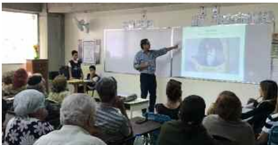
Una de las sesiones de Limud

mido el reto de llevar adelante esta iniciativa, entre ellos Brasil, México, Chile, Perú, Colombia, Estados Unidos y Argentina; en este último, la experiencia Limud Buenos Aires ya ha cumplido 11 años de realización ininterrumpida.