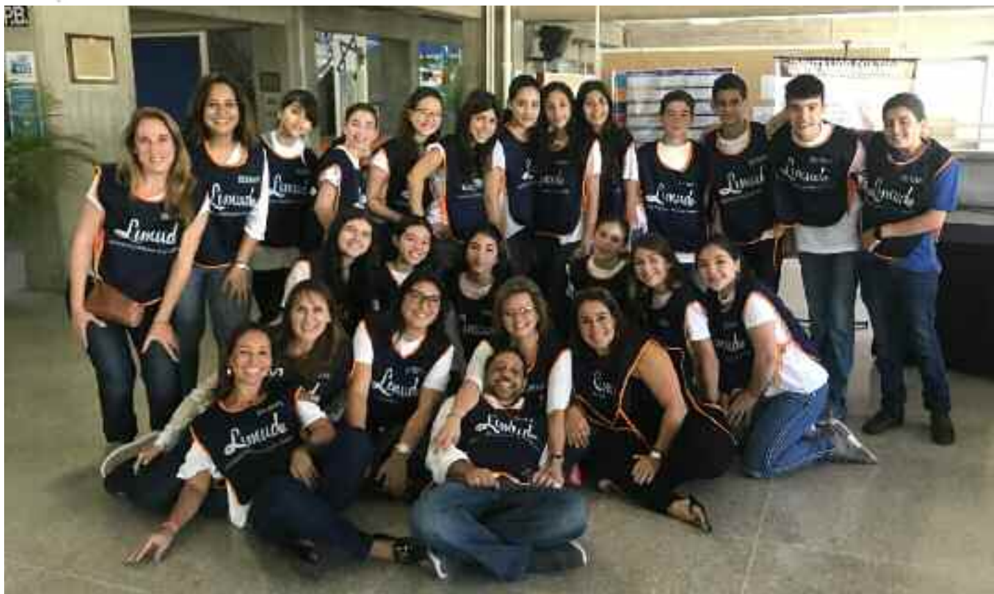
Equipo de voluntarios de la segunda edición de Limud Caracas