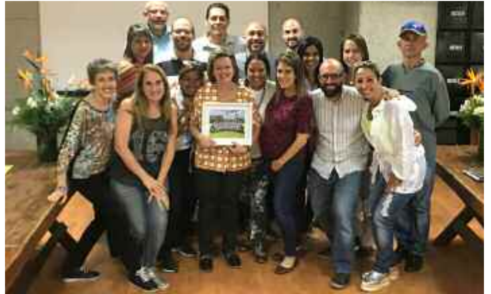
Con el equipo de profesionales de la institución