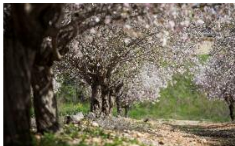
Almendros en flor en Latrún, valle de Ayalón, Israel

Con información de www.centrokehila.wordpress.com