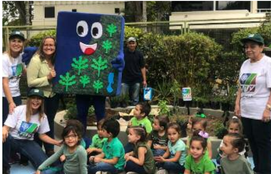
En las actividades del KKL, la diversión y el aprendizaje se unieron con los más pequeños en Tu Bishvat

Finalmente acompañamos a los alumnos de la primaria del colegio Or Jabad, con quienes sembramos plantas alimenticias, se les ofreció una breve charla sobre el significado de Tu Bishvat, y compartimos mo-