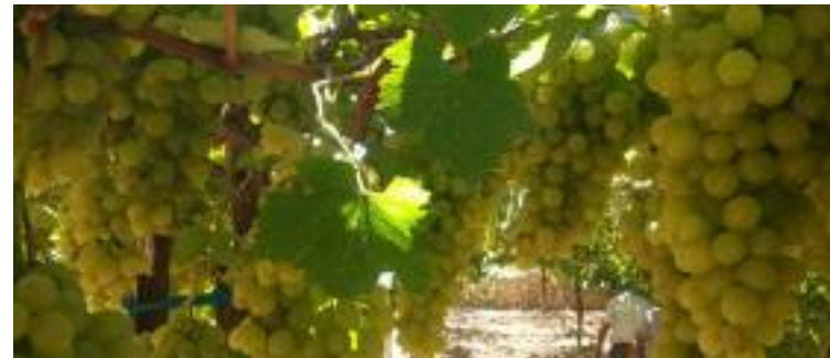
Uvas de la variedad Marawi cultivadas en Israel

Esta costumbre revela la belleza profunda del judaísmo: los instintos humanos no son inherentemente positivos o negativos; pueden ser constructivos o destructivos dependiendo de la orientación que uno les dé. Así, el judaísmo no prohíbe ningún tipo de placer, solo le da una dirección positiva.