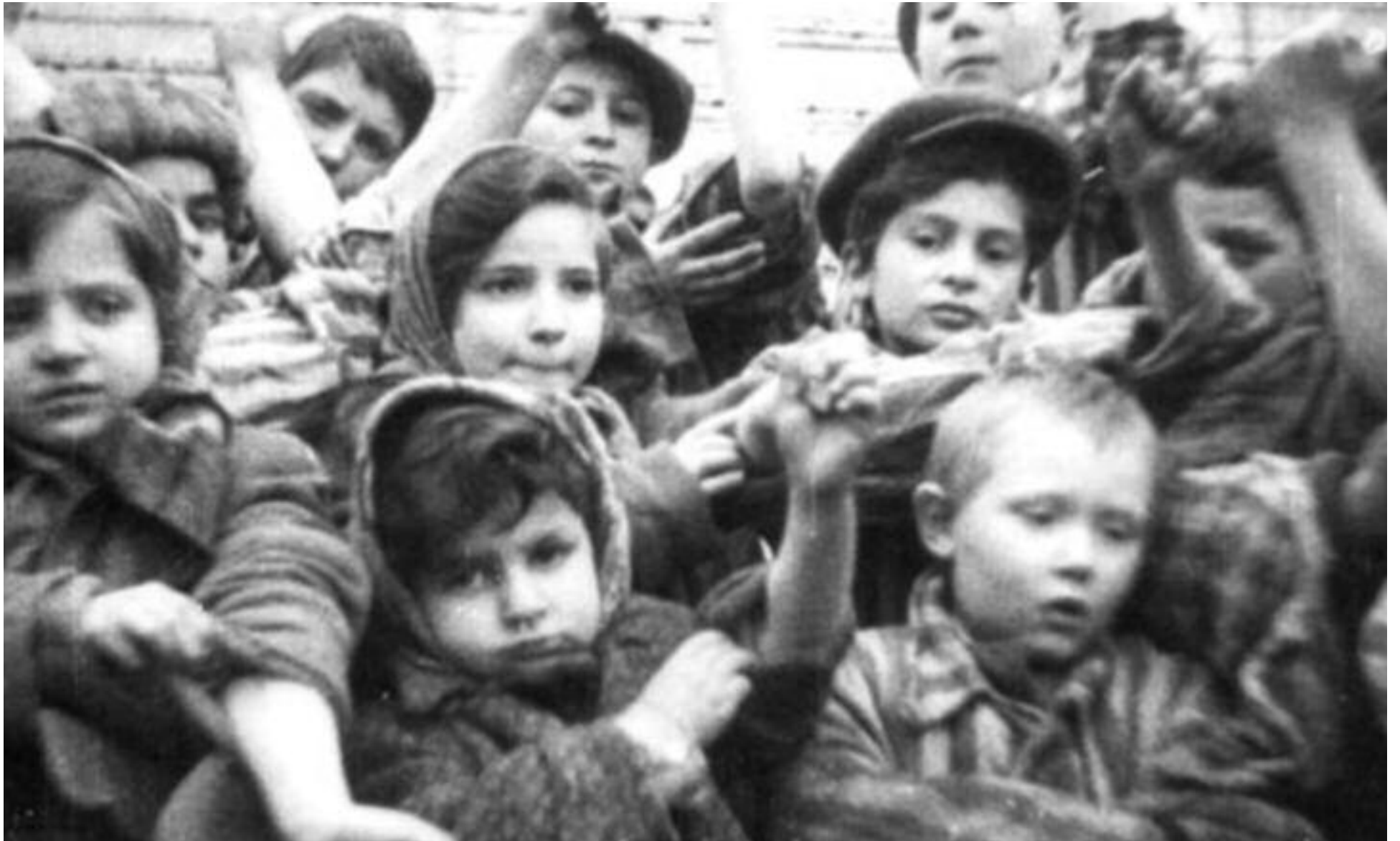
Inmediatamente tras la liberación del campo de exterminio de Auschwitz, unos niños sobrevivientes muestran los números tatuados en sus brazos

conducidos por heroicos salvadores a Palestina, tuvieron desagradables repercusiones en la prensa.