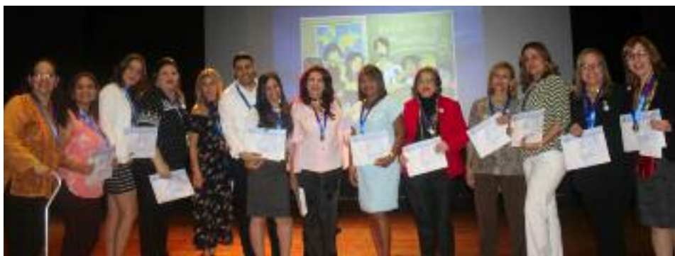
El personal docente y administrativo condecorado por años de servicio