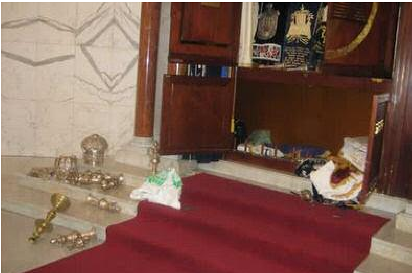
Angustia: el Arón Hakodesh de la sinagoga Tiféret Israel tras aquella noche fatídica