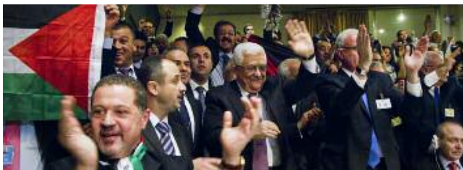
Existencia simbólica: la delegación palestina, encabezada por Mahmud Abbas, celebra que la Asamblea General de la ONU le otorgó el estatus de "Estado observador no miembro", en noviembre de 2012

El país que sí existe, pero cuya existencia no es reconocida, ha hecho florecer el desierto y está a la vanguardia en materia de medicina y ciencia, lo cual despierta la envidia de otros países y entonces proponen boicotarlo... pero ¿cómo se puede boicotear a un país cuya existencia no es reconocida? Pero sí se reconoce su historia milenaria, cuna de todas las religiones