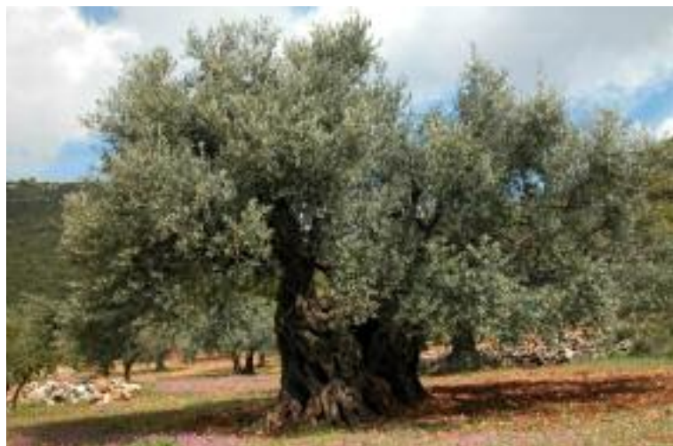
Antiguo olivo en el monte Merón, Alta Galilea