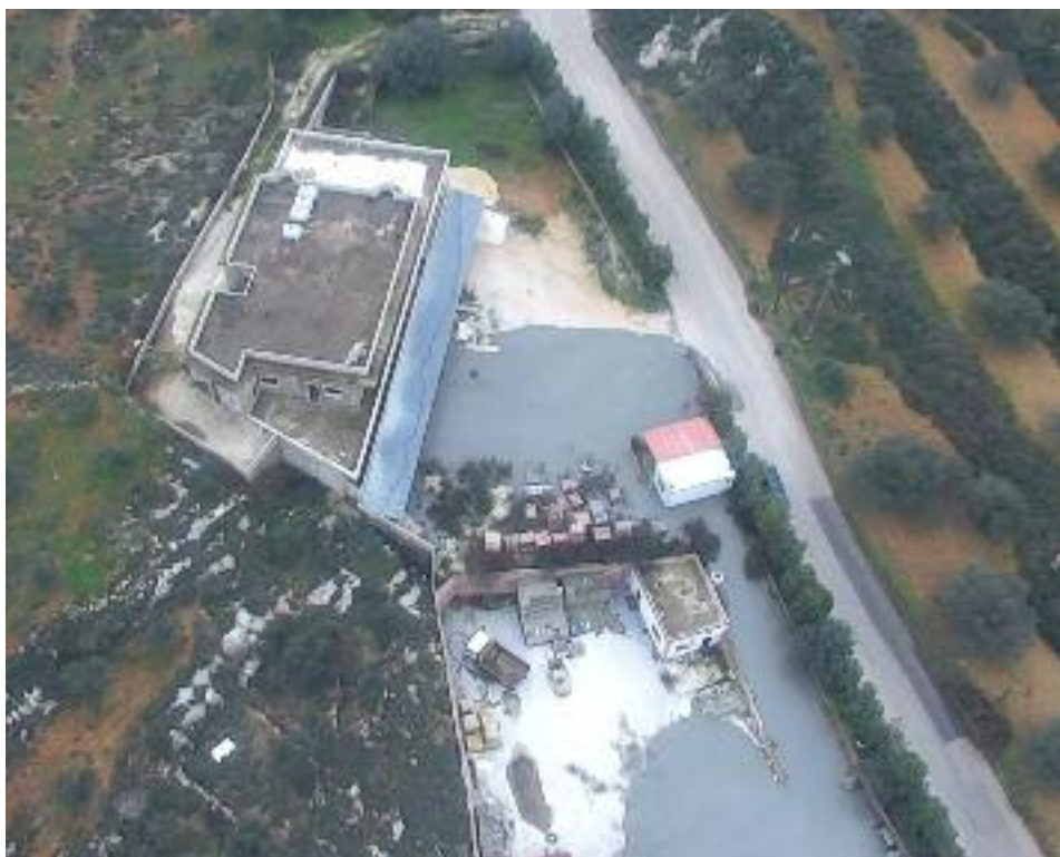
Cemento líquido, bombeado desde Israel a través de uno de los túneles que construyó Hezbolá para invadir la Galilea, inunda una falsa granja avícola y fluye por las calles del pueblo libanés de Kafr Kila. La imagen fue tomada por un dron israelí

Israel ha completado 27 kilómetros de una barrera subterránea diseñada para bloquear túneles; esta barrera también se extenderá hacia el Mediterráneo, para evitar la infiltración de Hamás desde el mar.