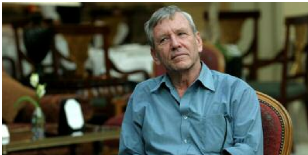
Recibiendo el premio Príncipe de Asturias de Literatura en 2007, por parte del actual rey Felipe VI

El ganador del Premio Israel recibió decenas de galardones y sus obras se tradujeron a 45 idiomas. Fue activista por la paz y partidario de la solución de dos Estados