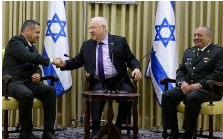
El presidente Reuven Rivlin saluda al jefe de Estado Mayor entrante, Aviv Kojavi. A la derecha el jefe saliente, Gadi Eisenkot

medios y el público. Puedo decir esto hoy. No me pareció correcto decirlo en 2015, 2016 o 2017".