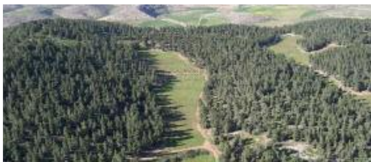
El famoso bosque Yatir ha sido un medio efectivo para frenar al desierto del Néguev, y luego hacerlo retroceder