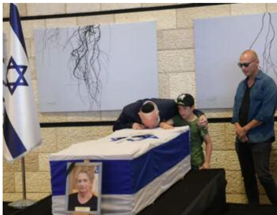
El presidente de Israel, Reuven Rivlin, besa el ataúd de su esposa acompañado de su hijo y un nieto

"Cuando fui elegido presidente tú decías que siempre tenemos que ser reales, auténticos. Fomentabas todo lo que sabías que era bueno. Todos aquí te aman". La señora Rivlin participó en muchas actividades de beneficencia.