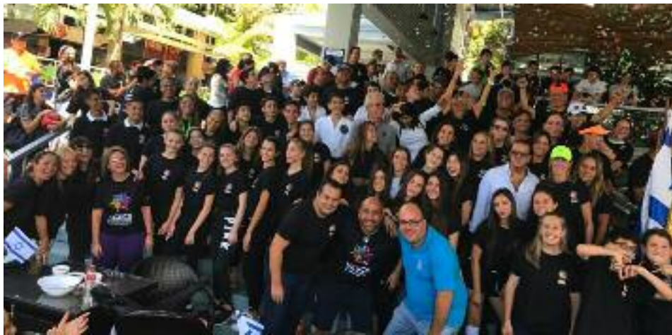
La delegación de Hebraica está preparada y dispuesta para dejar muy en alto a Venezuela

Karina Anidjar, Departamento de Comunicaciones e Información del CSCDR Hebraica / Redacción NMI