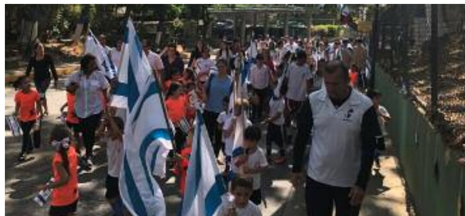
La "Marcha por la Vida" en que participaron los niños del Colegio Moral y Lucos