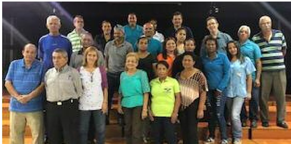
El equipo de trabajadores del SEC

Seguidamente, en nombre de las Sociedades de Padres y Representantes del SEC,