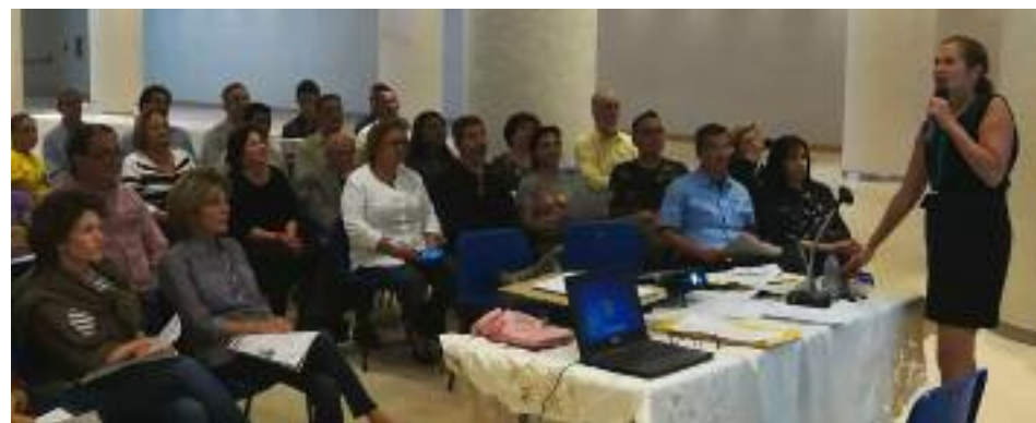
Público asistente a una de las conferencias