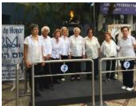
Abuelas de la Edad de Oro participaron en las guardias de honor de Yom Hazicaron