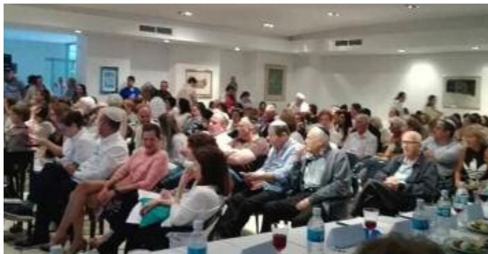
Público asistente al Séder

Karina Anidjar, Departamento de Comunicación e Información del CSCDR Hebraica / Redacción NMI.