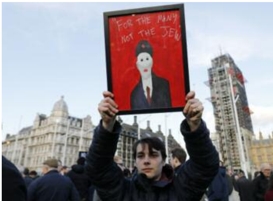
Los judíos británicos han salido a las calles para protestar por las posiciones antisemitas de Jeremy Corbyn

Ahora, en Estados Unidos, tienen a su propia Ilhan Omar, una congresista demócrata que tuiteó en 2012 que "Israel ha hipnotizado al mundo". El mes pasado dijo ante una audiencia en Washington sobre los judíos que apoyan a Israel: "Quiero hablar sobre una influencia política en este país considera que está bien presionar a favor de la lealtad a un país extranjero".