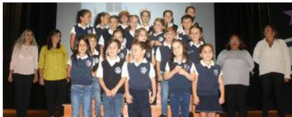
Los pequeños graduandos terminaron felices la etapa Pre-escolar

El SEC felicita a estos jovencitos por haber culminado sus estudios de Primaria, y les desea mucho éxito a lo largo de sus estudios.