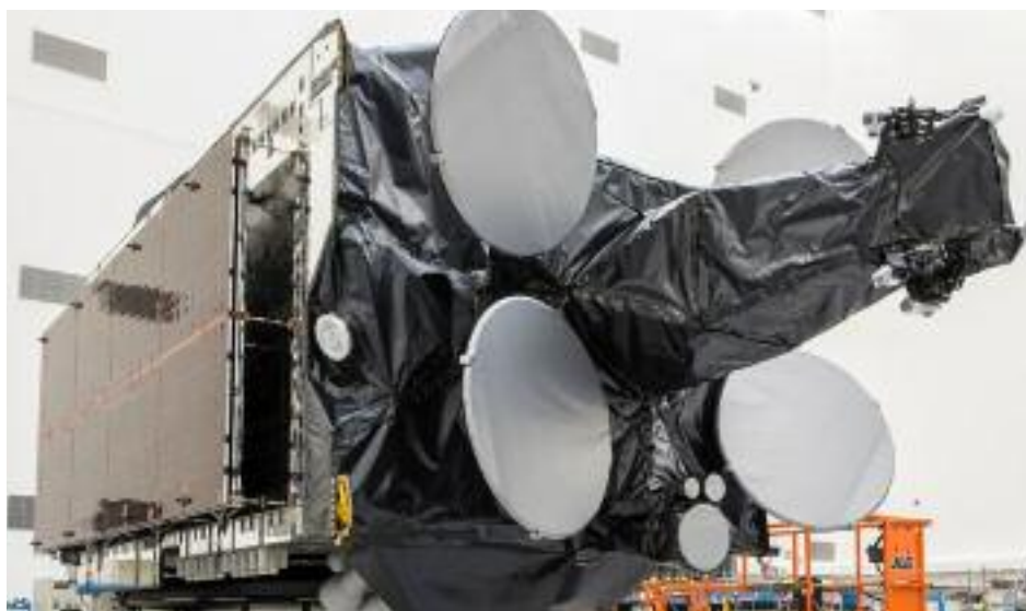
El satélite israelí Amós 17 durante la preparación para su lanzamiento en la sede de la firma SpaceX