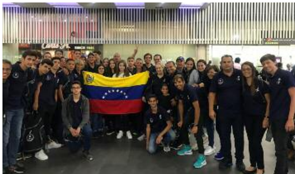
La delegación venezolana en México