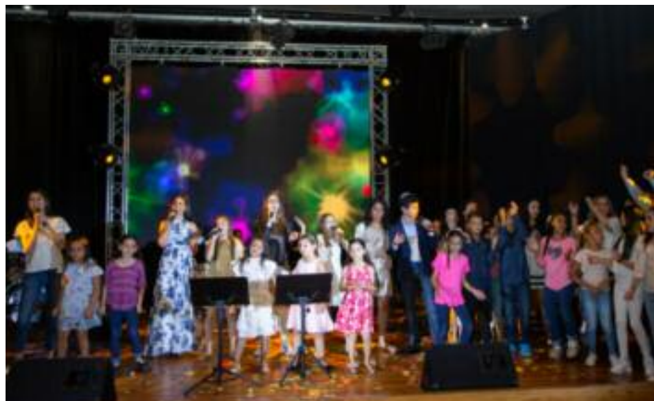
Momento del cierre de la Gala Yom Yerushalaim "Visión 20/20"

La Gala Yom Yerushalaim siempre ha dedicado un espacio a enaltecer la labor de una persona, y este año fueron tres los me-