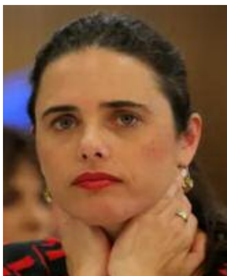
Ayelet Shaked encabeza la lista de la nueva derecha

En un encuentro celebrado el 29 de julio, los miembros de la nueva coalición se comprometieron a apoyar unánimemente al primer ministro Benjamín Ne-