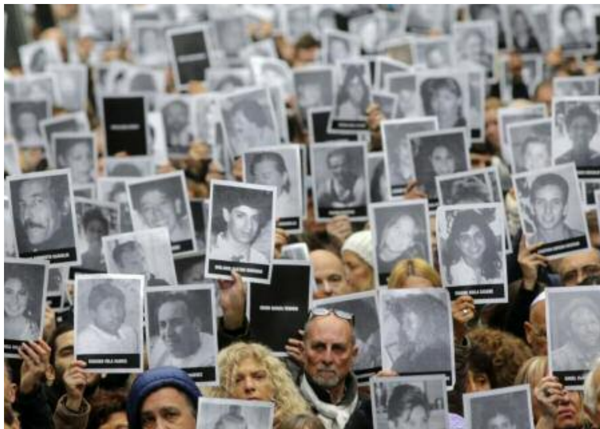
Una de las multitudinarias manifestaciones en reclamo de justicia por el atentado contra la AMIA