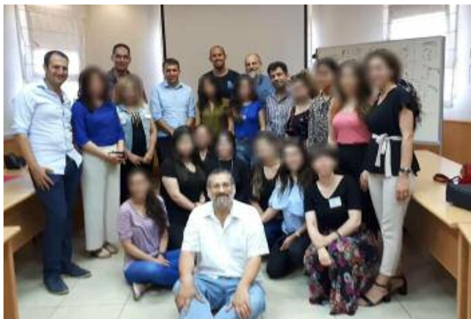
Los rostros de las trabajadoras yazidíes que estuvieron en Israel aparecen ocultos para salvaguardar su seguridad

El programa conjunto de Bar Ilán e IsraAID fue creado para mejorar la asistencia a las víctimas y brindarles el