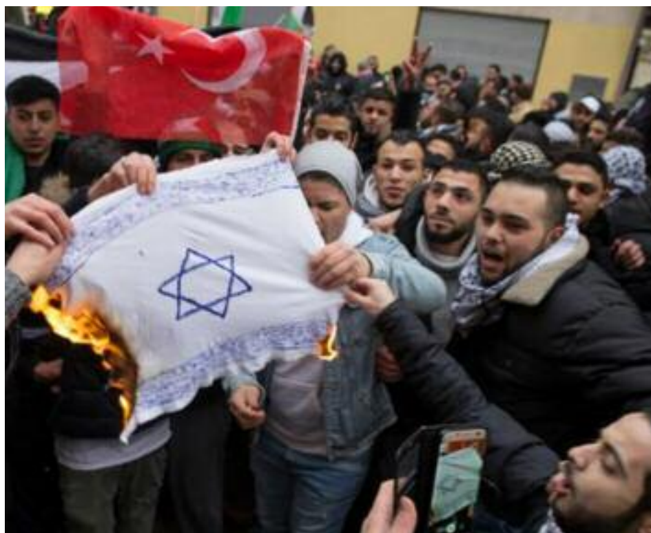
La quema de la bandera de Israel trajo espeluznantes recuerdos en Alemania

La Agencia Alemana para la Seguridad Nacional ( Bundesamt fuer Verfassungsschutz ) acaba de editar un informe de 40 páginas titulado "Antisemitismo en el islamismo". Nunca antes una agencia de inteligencia europea había publicado un informe sobre el antisemitismo musulmán; se trata de una ruptura importante con el pasado, y constituye la primera publicación oficial de un organismo nacional que expone en detalle el antisemitismo que se origina en partes de la comunidad musulmana del país.