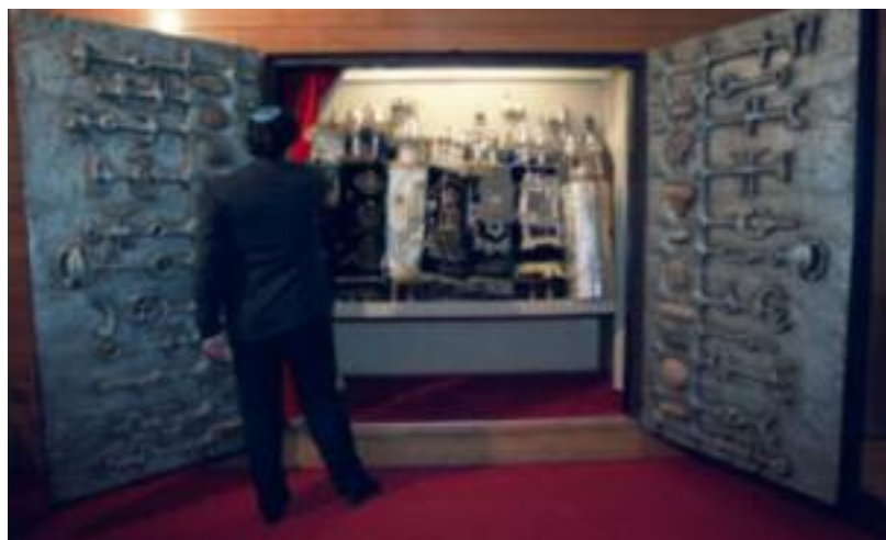
Arón Hakodesh de la sinagoga Beth Yaacov de Madrid