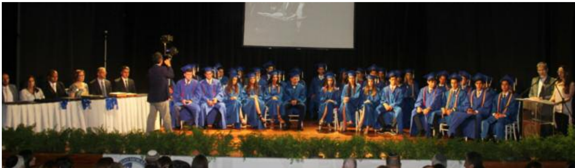
El grupo de graduandos y la mesa directiva

PROMOCIÓN OROT SHEL TIKVÁ , “LUCES DE ESPERANZA”