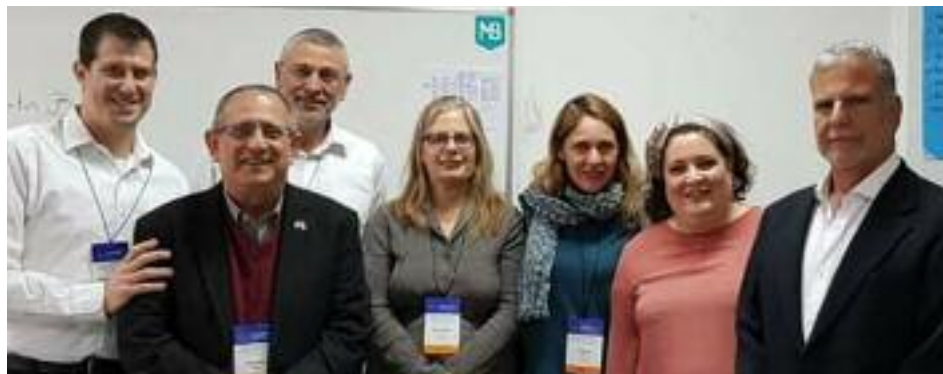
Los organizadores del encuentro

Joskowicz expresó su alegría por ver sentados juntos a los dirigentes de las principales instituciones judías con los educadores, a los que destacó por ejercer una pasión: enseñar. “Estoy convencido