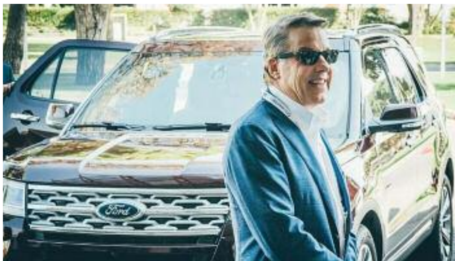
Bill Ford durante su participación en EcoMotion en Tel Aviv

Ford, quien visitaba Israel por primera vez, dijo que el ecosistema y la energía que vio son "fantásticos", señalando particularmente el enfoque igualitario que tienen los israelíes. "La falta de jerarquía aquí me encanta", dijo a un entrevistador durante la conferencia. "Creo que genera innovación. Las empresas europeas y americanas, que tienden a ser más jerárquicas, sofocan sin saberlo la innovación; el hecho de que Israel carezca de jerarquías lo convierte en un gran lugar para comenzar, y que se escuche la voz de cada quien desde el principio del proceso".