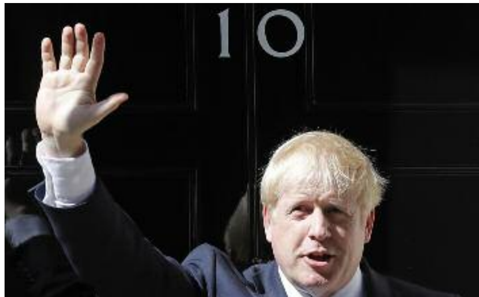
Boris Johnson a las puertas de su mandato

"Bajo tu liderazgo, Israel se ha convertido en una potencia tecnológica y en una economía de renombre mundial", escribió