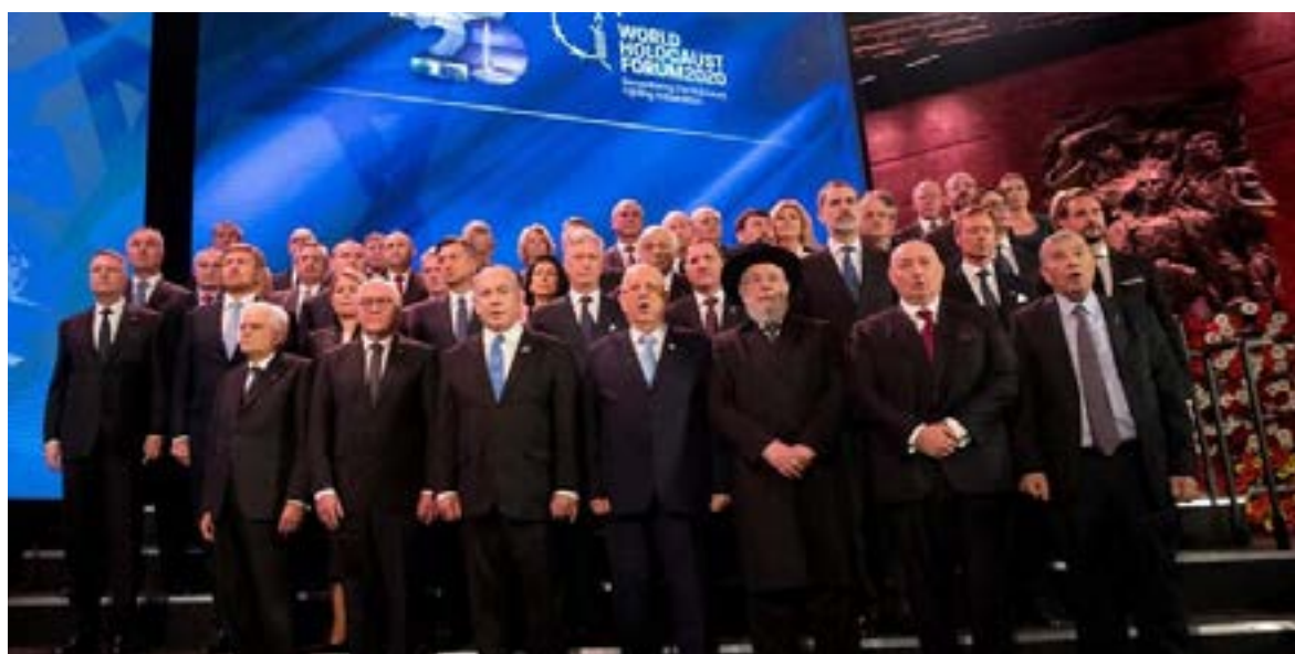
Una de las fotografías oficiales del evento en Yad Vashem. En primera fila aparecen el presidente de Israel, Reuven Rivlin; el de Alemania, Frank-Walter Steinmeier; el primer ministro israelí, Benjamín Netanyahu; Israel Meir Lau, ex Gran Rabino asquenazí de Israel y presidente del Consejo de Yad Vashem; Moshe Kantor, presidente de la Fundación Mundial Foro del Holocausto; y Avner Shalev, presidente del Directorio de Yad Vashem

Pese a ello, Steinmeier dijo no poder afirmar que Alemania haya aprendido de la historia, dados los recientes casos de antisemitismo, y agregó que su país parece comprender mejor el pasado que el presente, “cuando se extienden el odio y la instigación al odio, cuando se escupe a los niños judíos en los