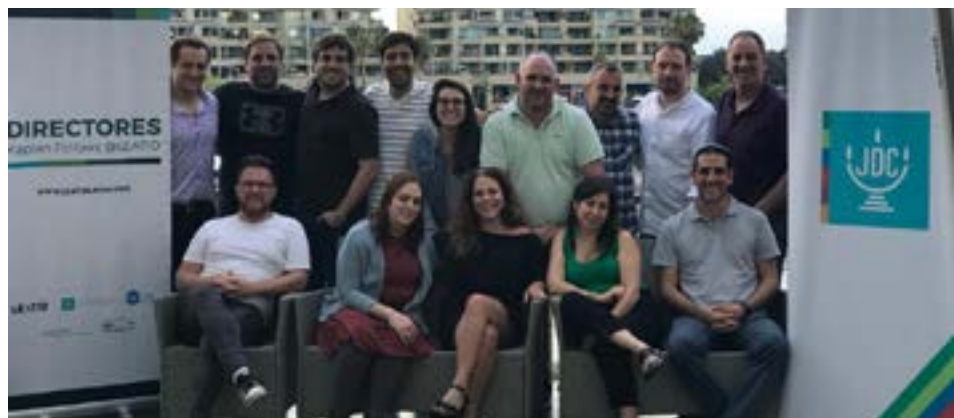
Grupo de participantes de la séptima cohorte de Leatid, durante el encuentro en Buenos Aires