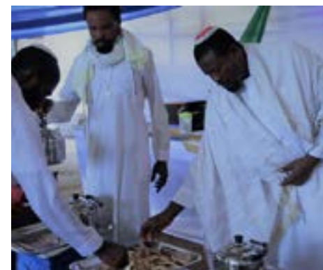
Miembros de la comunidad comparten matzá durante la festividad de Pésaj