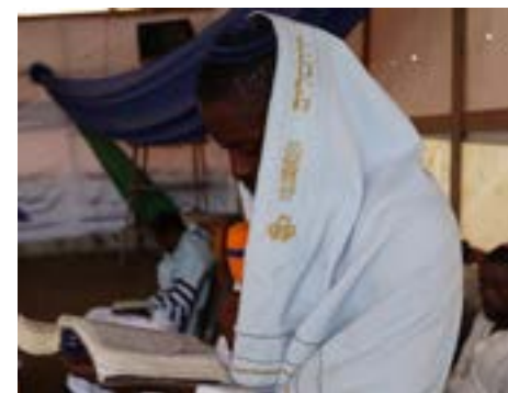
Joven igbo en oración