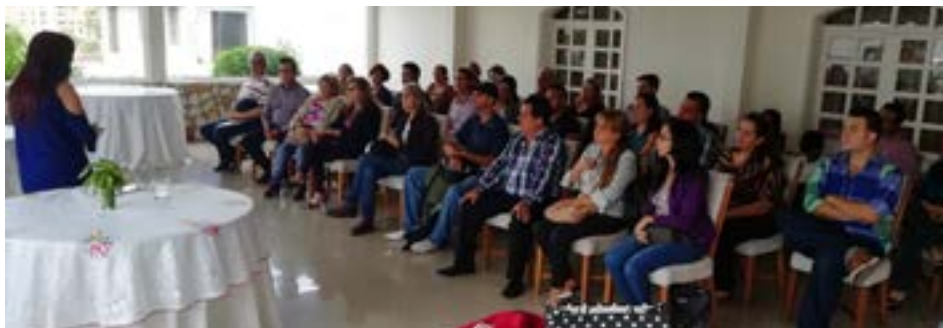
El público asistente a este segundo encuentro dedicado a la aliá , en la ciudad de San Cristóbal

Entre los temas tratados, los asistentes pudieron conocer de la mano de