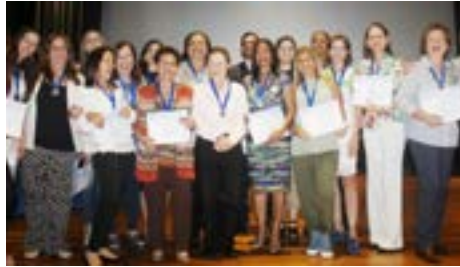
El grupo de docentes y personal administrativo condecorado por años de servicio

Por la tarde, el Auditorio Jaime Zighelboim del liceo se vistió de gala para honrar con la