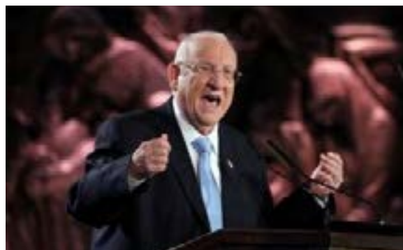
El presidente de Israel, Reuven Rivlin, durante su discurso inaugural

sino por sus secuaces en varios países". Este último comentario alude al actual roce retórico entre Polonia y Rusia, que han intercambiado acusaciones sobre su responsabilidad en el estallido de la Segunda Guerra Mundial y el genocidio.