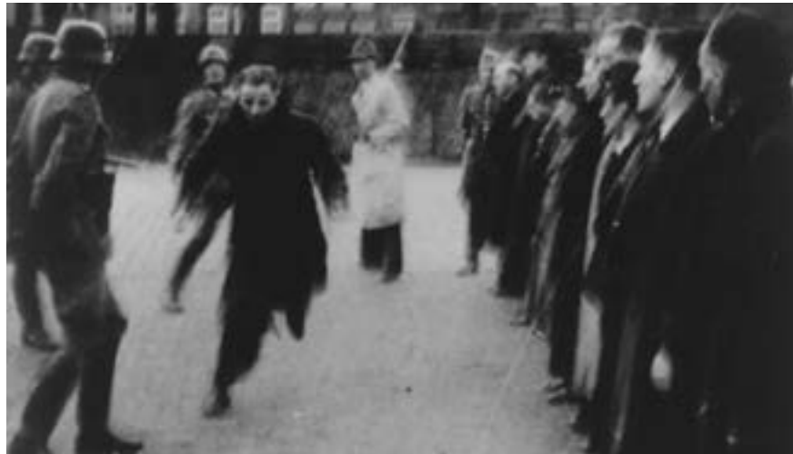
Portada de la traducción al inglés de Última parada Auschwitz