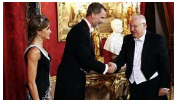
El rey Felipe VI y la reina Letizia de España saludan al presidente Reuven Rivlin durante la cena de Estado previa al Foro. Rivlin expresó: “Su Majestad, sabemos de su gran amistad con los palestinos. Necesitamos que nos ayude a convencerlos de que el Estado de Israel está aquí para quedarse, y que es el único hogar del pueblo judío”