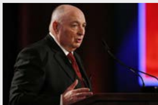
Moshe Kantor, presidente de la Fundación Mundial Foro del Holocausto y del Congreso Judío Europeo

El V Foro Mundial sobre el Holocausto fue organizado por la Fundación Mundial Foro del Holocausto, creada y presidida por Moshe Kantor, quien también preside el Congreso Judío Europeo. Este es el texto completo de su discurso