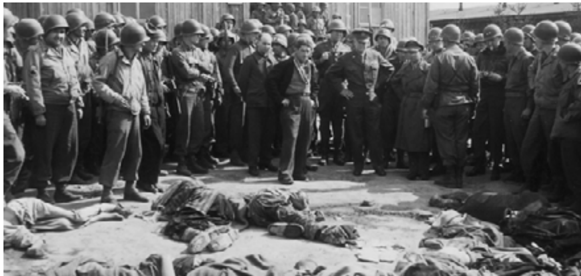
El general estadounidense Dwight Eisenhower, Comandante Supremo de las Fuerzas Aliadas en Europa, observa cadáveres de prisioneros en el campo de Ohrdruf, Alemania