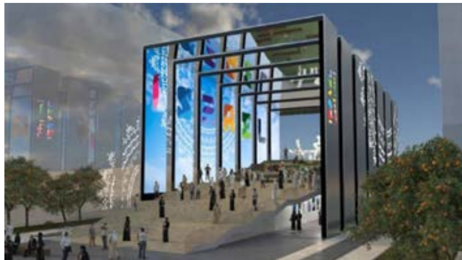
Imagen artística del pabellón de Israel en Expo Dubai 2020

El edificio quiere reflejar la idea de que Israel forma parte de Oriente Medio y que es