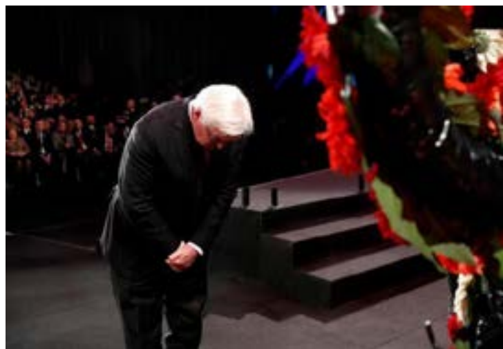
El presidente de Alemania, Frank-Walter Steinmeier, en el momento de presentar sus respetos ante el monumento a las víctimas de la Shoá en Yad Vashem