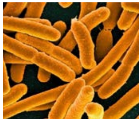
Bacterias E. coli

Como estos fotosintetizadores pueden ser difíciles de modelar genéticamente, el equipo de Weizmann, bajo la dirección del profesor Ron Milo, tomó la bacteria E. coli , comúnmente asociada con la intoxicación alimentaria, y pasó varios años capacitán-