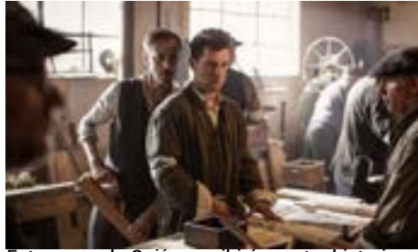
Fotograma de Quién escribirá nuestra historia

Cabe destacar que antes de la proyección de la película se presentó un cortometraje introductorio preparado por Espacio