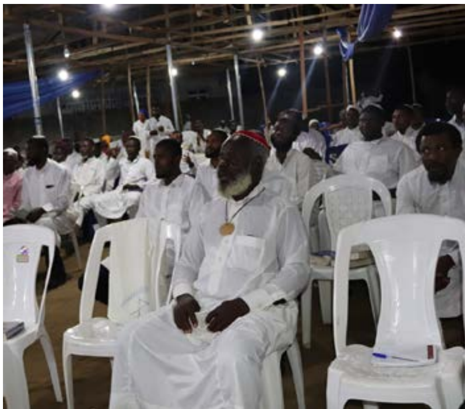
Feligreses igbo en una sinagoga de la ciudad de Port Harcourt