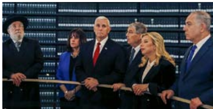
El vicepresidente de Estados Unidos, Mike Pence, durante su visita al museo de Yad Vashem en compañía del primer ministro Netanyahu, su esposa Sara, el rabino Israel Meir Lau y Avner Shalev