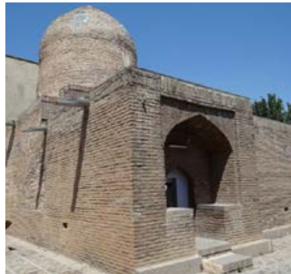
El Mausoleo de Esther y Mordejai en Hamadán, al oeste de Irán

Según el reporte, que no ha sido confirmado, miembros de la organización oficial Basij pretenden atentar contra el lugar en respuesta al plan de paz anunciado por Trump y Netanyahu hace un mes.