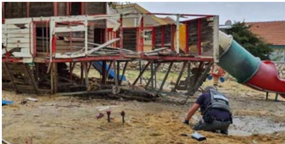
Policías buscan restos del cohete que cayó en un parque infantil de Sderot, al sur de Israel, el lunes 24 de febrero

Habíamos comenzado hace un rato esta nota, con la frase “sabemos de antemano que estas líneas quedarán desactualizadas pronto”. Dicho y hecho. El recuento hasta hace unos minutos era de una decena y media de cohetes disparados desde la Franja de Gaza hacia territorio israelí en lo que iba de este lunes 24 de febrero. Y hasta la apertura tuvimos que cambiar, porque ni alcanzamos a publicar este texto y ya estaban sonando las alarmas de nuevo, esta vez en la ciudad de Ashkelon.