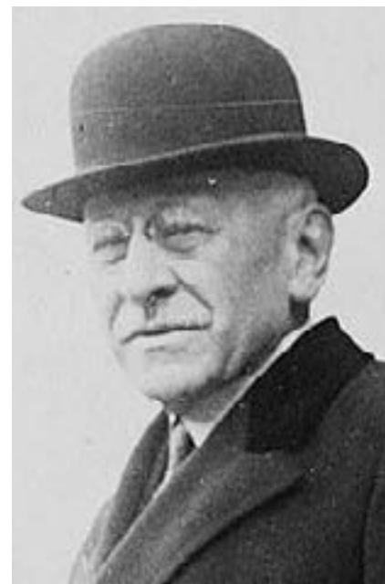
Julius Rosenwald

El tráiler de Rosenwald está disponible en YouTube