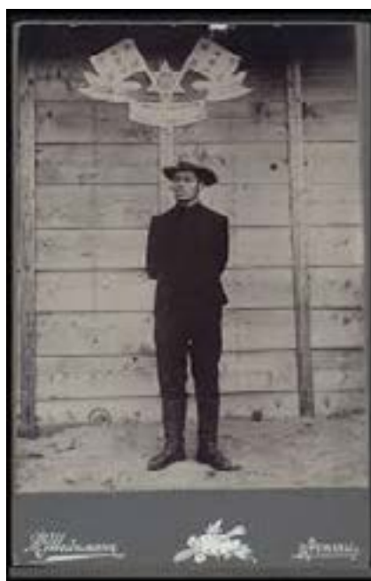
Trumpeldor mientras era prisionero de guerra de Japón a los 25 años de edad, en 1905. El letrero, decorado con símbolos sionistas, dice en hebreo: "Hijos de Sión prisioneros en Japón"

Hace cien años, Éretz Israel —hasta entonces parte de la Palestina otomana— acababa de ser conquistada por los británicos, en la recién finalizada Primera Guerra Mundial. La Declaración Balfour de 1917, que postulaba la creación de un “hogar nacional judío” en su tierra ancestral, había generado entusiasmo en el joven movimiento sionista, y las posibilidades de crear un Estado judío parecía no tener más obstáculos que la demasiado pequeña inmigración de pioneros, casi todos del ex Imperio Ruso y los países de Europa Oriental.