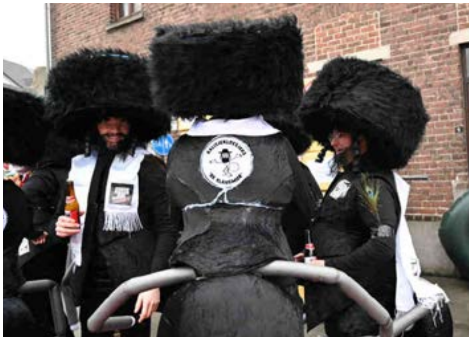
“Judíos insectos” en Aalst, Bélgica. Abajo: nazis felices con sus crematorios en Criptana, España

Sin embargo, este año el evento fue aún más allá, con personas disfrazadas