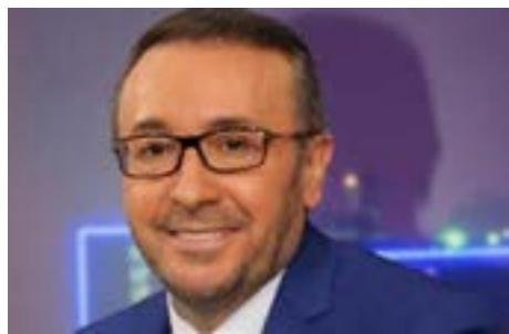
“Traidor” por poner el dedo en la llaga: Faisal al-Qassem, periodista de al-Jazeera

Ante la polémica, Faisal al-Qassem volvió a tuitear: “Lo que digo es que el proyecto sionista prosperó, a diferencia de los fracasados