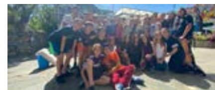
Jóvenes de primer año que participaron en Robinson

Escanee este código QR para ver más fotos