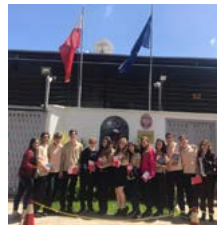
El grupo frente a la embajada de Polonia

La visita fue muy provechosa para obtener datos muy precisos sobre la Polonia del siglo XXI, que no se encuentran en Internet.