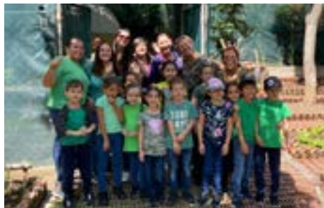
Los niños de Preescolar y sus maestras en el huerto

Los estudiantes de Primaria tuvieron la oportunidad de asistir el vivero Jardín Boyacá, donde acompañados por sus morim , representantes y el personal del Keren Kayemet LeIsrael, disfrutaron de una visita guiada sobre la diversidad de plan-