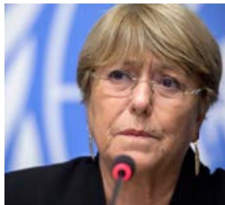
Su presencia no ha cambiado nada en el Consejo de Derechos Humanos: Michelle Bachelet

Sí, nuestra responsabilidad también se extiende a los árabes de nuestro país, y debemos asegurarnos de que la vida de cada persona en nuestro país sea una vida normal. Sin embargo, aquellos que se levantan y continúan reclamando la propie-