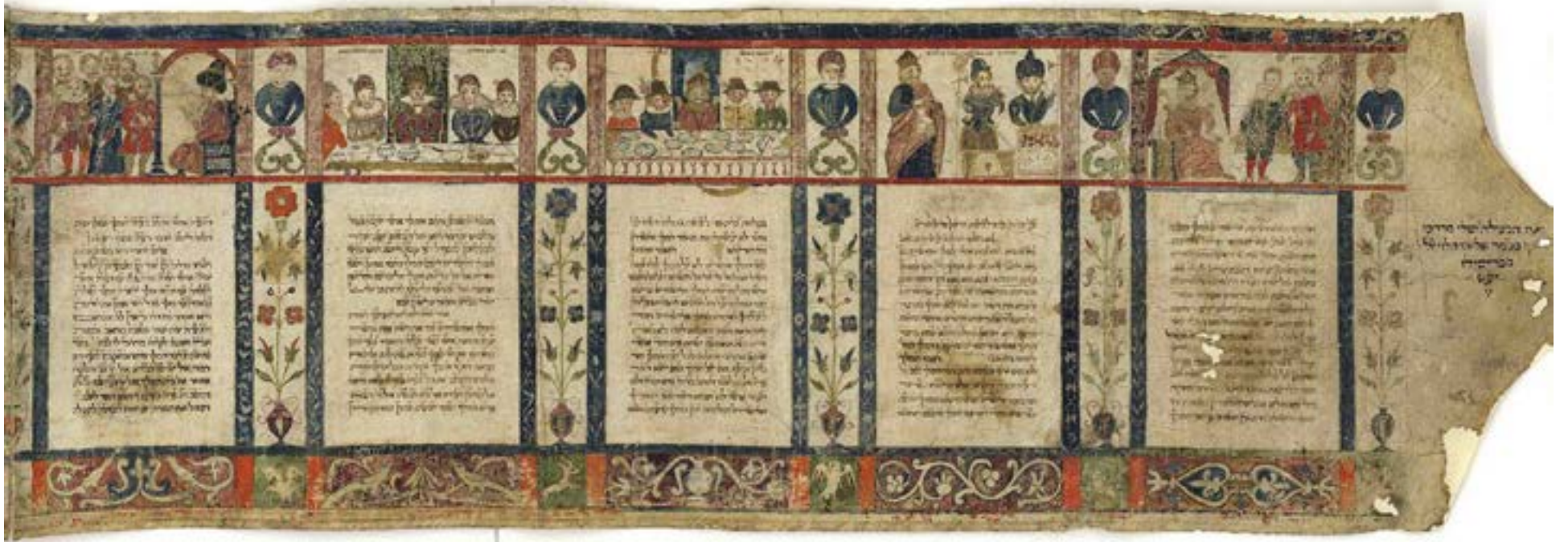
Megilat Esther, Italia, año 1616