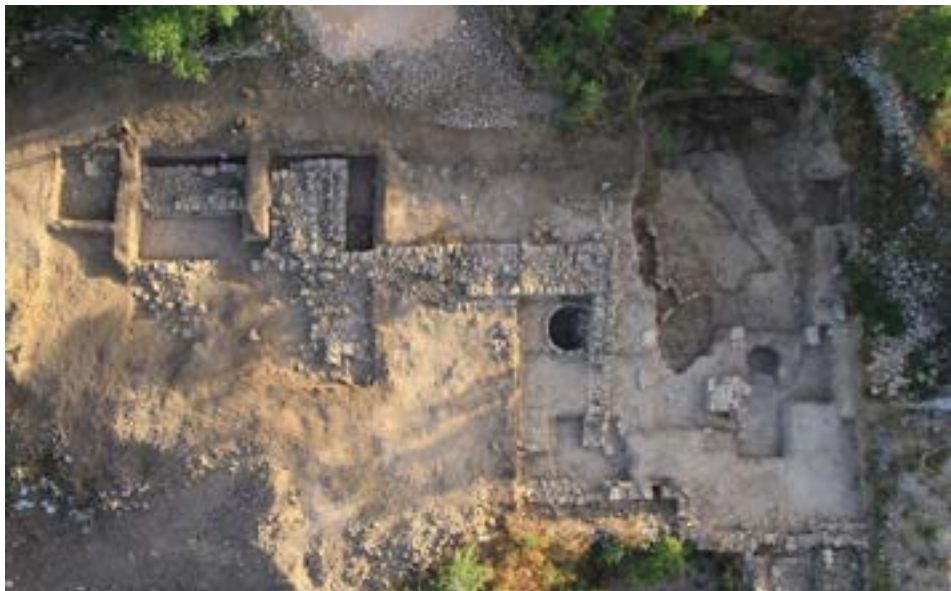
Vista aérea de la excavación en Tel Motza