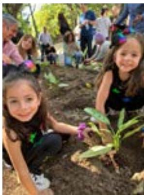
Un momento de la siembra durante el domingo familiar

El CSCDR Hebraica sembró un árbol en honor a los 100 años del Keren Hayesod. Asimismo, la División Femenina del Keren Hayesod compró 10 árboles para regalar a Hebraica y así juntos sembrar en favor de la comunidad judía de Venezuela.