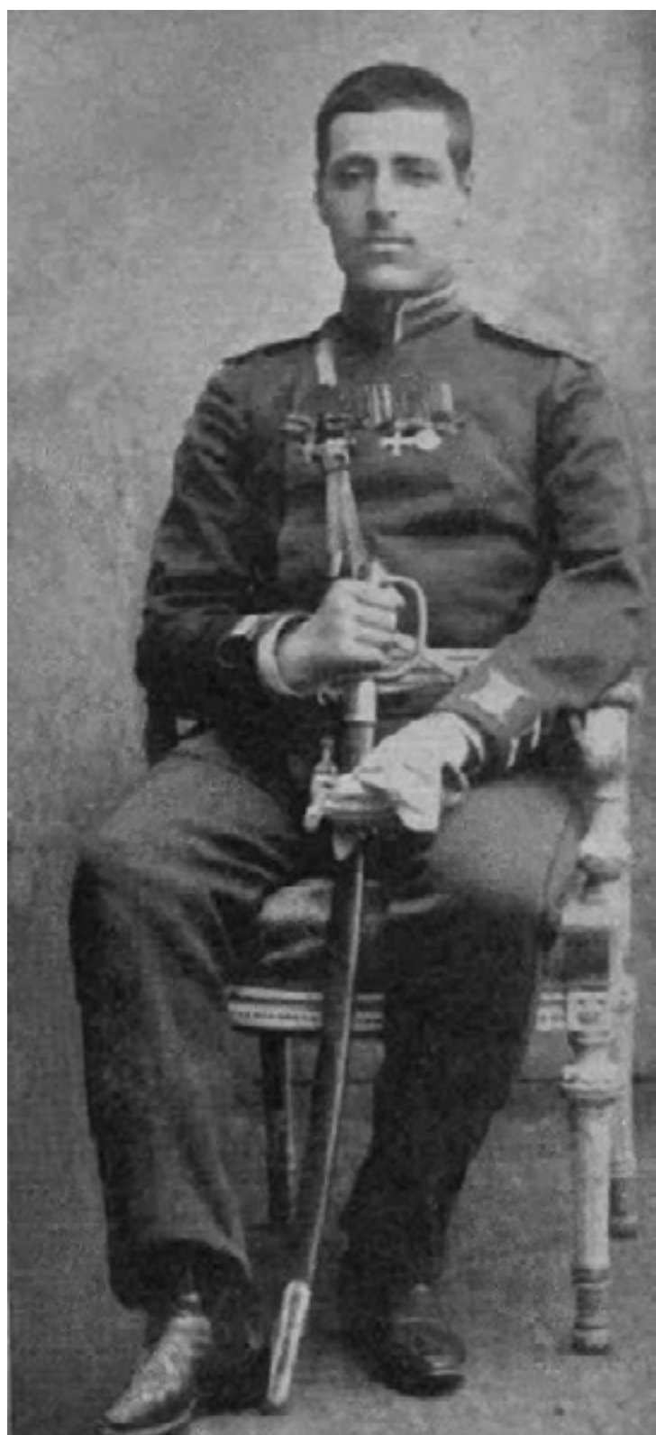
Josef Trumpeldor como oficial del ejército ruso, circa 1903

POR SU VALENTÍA DURANTE LA GUERRA RUSO- JAPONESA, TRUMPELDOR RECIBIÓ CUATRO CONDECORACIONES INCLUYENDO LA CRUZ DE SAN JORGE, LO QUE LO CONVIRTIÓ EN EL SOLDADO JUDÍO MÁS CONDECORADO DE TODA RUSIA