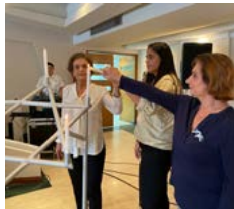
Sobrevivientes de la Shoá encienden las velas conmemorativas, junto a una representante del movimiento juvenil Noar Le Noar