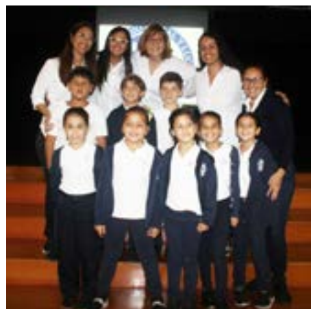
Los alumnos ganadores junto a sus profesoras

Felicitaciones a todos los alumnos por la dedicación y el empeño puestos en cada actividad realizada, y al equipo docente por motivar a los niños para la obtención exitosa de esta meta.