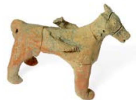
Figurilla de un caballo encontrada en el lugar

Debido a la proximidad de Motza a Jerusalén, los investigadores principales de la excavación, Kisilevitz y Oded Lipschits del Instituto de Arqueología de la Universidad de Tel Aviv, plantean la hipótesis de que ese sitio de culto estaba aprobado por las autoridades de Jerusalén. “No se podría construir un gran templo monumental cerca de Jerusalén sin permiso del gobierno”, dice Kisilevitz.